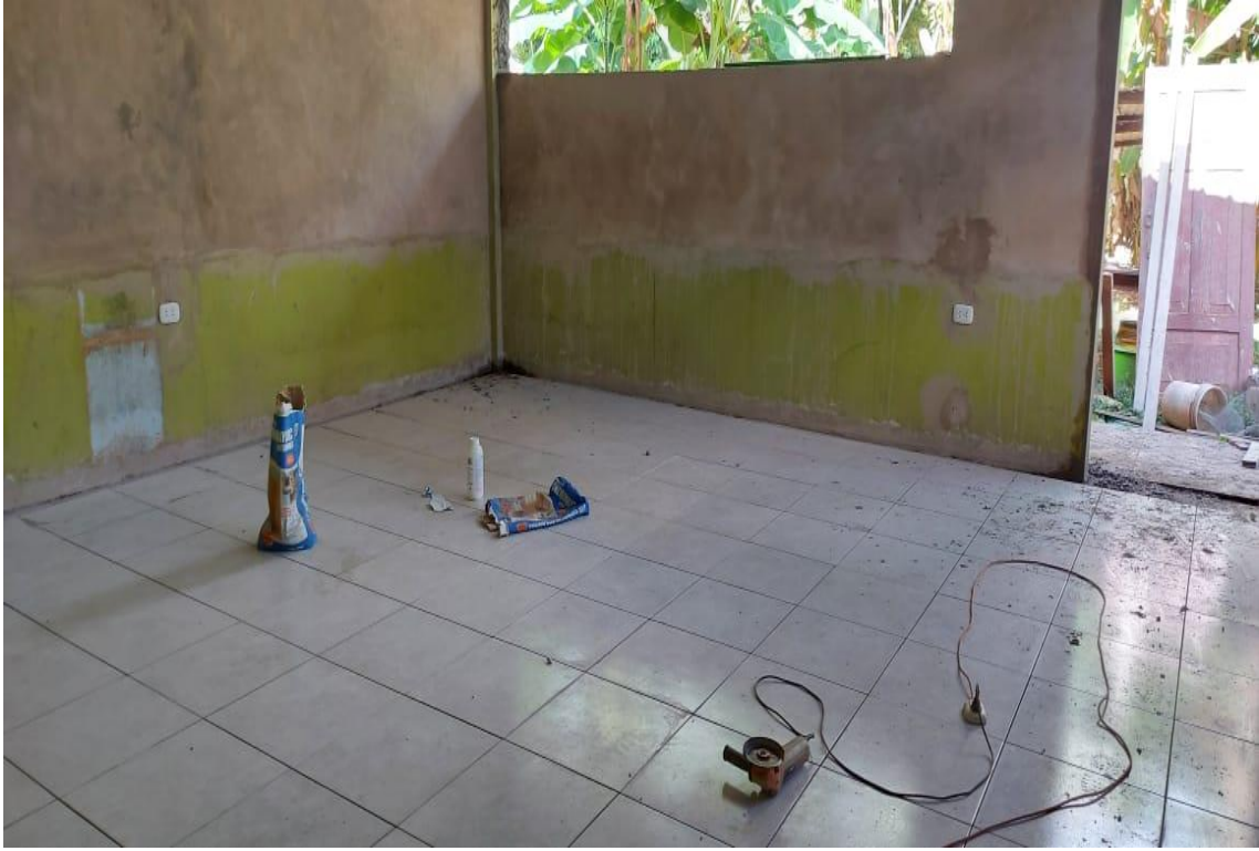
Pintado de los ambientes.