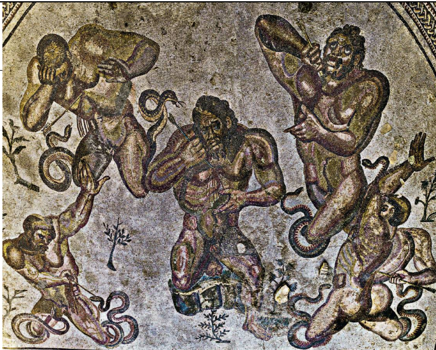
GHIGO ROLI / BRIDGEMAN IMAGES

Luigi Ginami Arminda Edizioni Messaggero Padova pagg. 152 euro 9