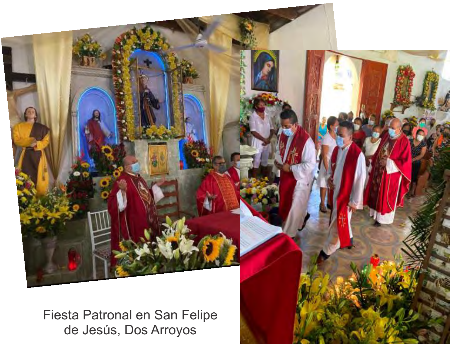
Fiesta Patronal en San Felipe de Jesús, Dos Arroyos