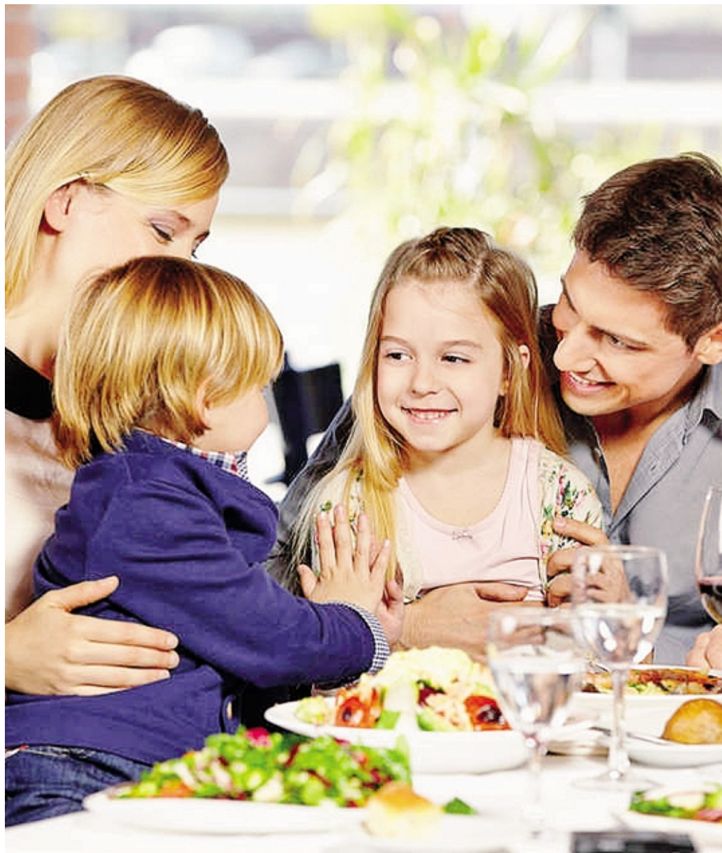
Bergamo si prepara a diventare una città family friendly