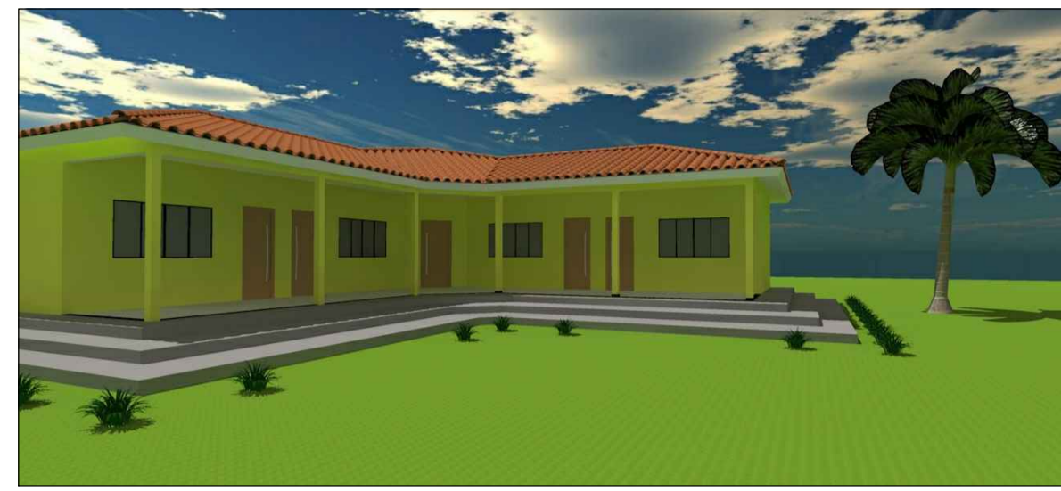
FACHADA B - B ESCALA 1:75