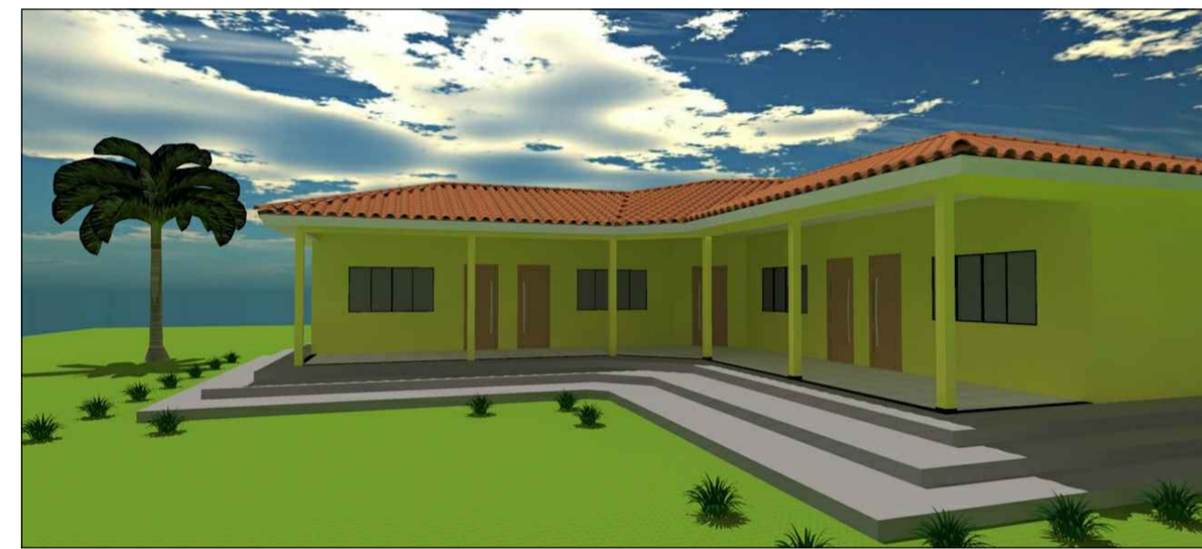
FACHADA A - A ESCALA 1:75