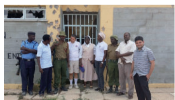
Missione di Santina a Garissa