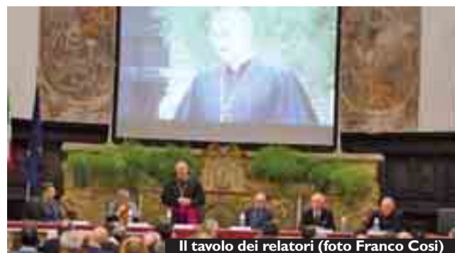
Il tavolo dei relatori