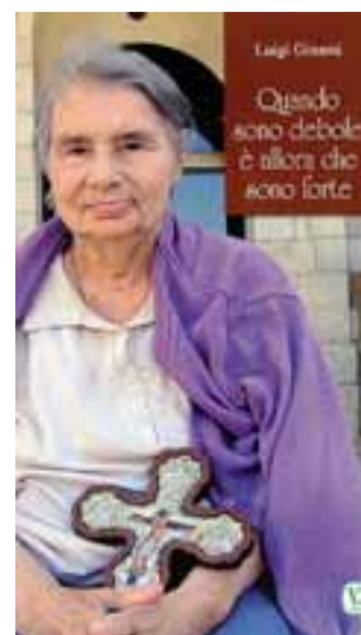
La copertina del libro di mons. Ginami

Il libro si suddivide in tre parti, con titoli a iniziale maiuscola per sottolineare la pregnanza della testimonianza materna: «L'Insegnamento», «La Testi-